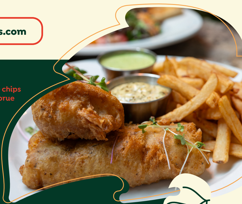
Fish & chips de morue