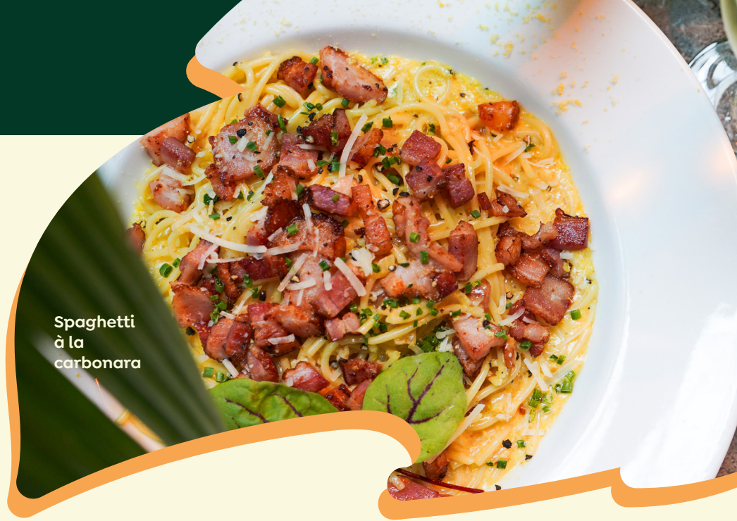
Spaghetti à la carbonara