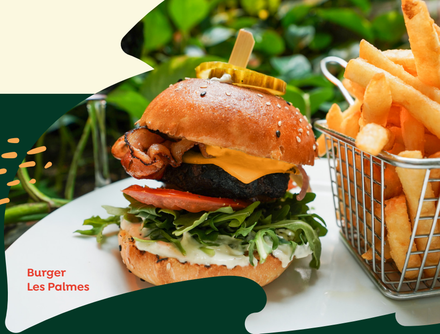
Burger Les Palmes