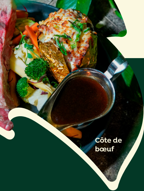
Côte de bœuf