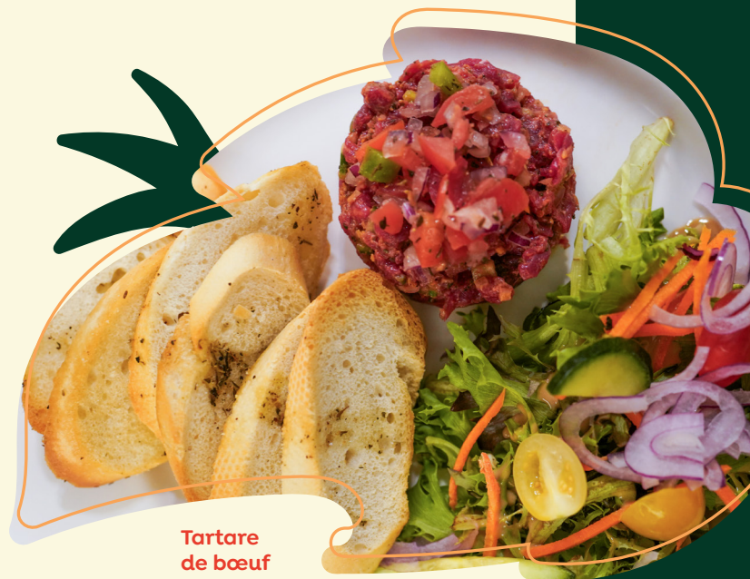
Tartare de bœuf

Veillez nous aviser de toute allergie ou intolérance alimentaire. Taxes et service en sus. Prix sujets à changements sans préavis.